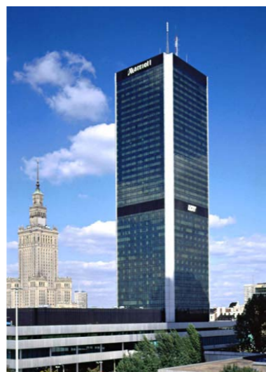
Hotel „WARSAW MARRIOTT HOTEL”

Użytkownicy dowolnie sterują klimatem w obsługiwanej przestrzeni (strefie) dzięki niezależnym sterownikom w pomieszczeniach lub poprzez zintegrowany system BMS budynku np. DP ViewNet firmy Dan-Poltherm , z możliwością zdalnej wizualizacji przy użyciu dowolnego urządzenia mobilnego czy komputera z przeglądarką internetową. Centrale klimatyzacyjne mogą dostarczać powietrze ze stałym bądź zmiennym wydatkiem powietrza.