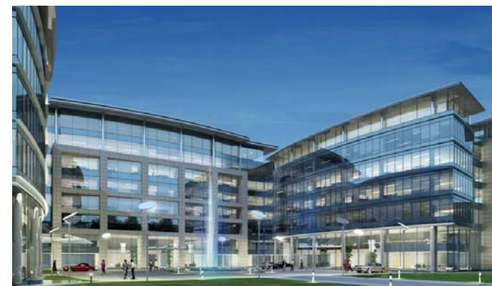
Biurowiec „TRINITY PARK III” w Warszawie

Rozwiązania DP R Comfort i DP R Basic można stosować w systemach, gdzie wymagana jest 100-procentowa wymiana powietrza oraz w systemach z recykulacją, gdzie centrale stanowią jedyne źródło chłodu i ogrzewania dla obsługiwanej przestrzeni (brak wewnętrznych systemów, np. klimakonwektorów).