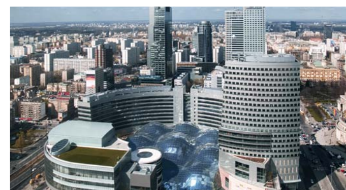
Kompleks handlowo-biurowo-rozrywkowy „ZŁOTE TARASY” w Warszawie

Wymienniki obrotowe central DP R oferują wysoki stopień odzysku ciepła zimą i chłodu latem, a dzięki higroskopijnej powierzchni w maksymalnym stopniu również odzyskują wilgoć tak pożądaną zimą dla zachowania pełnego komfortu przebywającym w pomieszczeniach ludziom. Wyższe wymagania odnośnie poziomu wilgoci w pomieszczeniach można zapewnić stosując jeden z wielu parowych systemów nawilżania brytyjskiej firmy VAPAC lub zabudowany wewnątrz urządzenia nawilżacz adiabatykny firmy Dan-Poltherm .