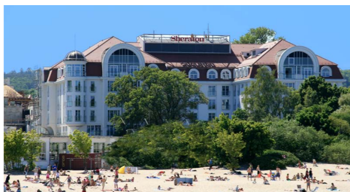
Hotel „SHERATON SOPOT HOTEL, CONFERENCE CENTER & SPA”

Głównym zadaniem central klimatyzacyjnych obiektów biurowych, hotelowych oraz edukacyjnych jest zapewnienie odpowiedniej ilości świeżego powietrza przebywającym w budynku osobom. Czasem zdarza się, iż centrale klimatyzacyjne / wentylacyjne stanowią główne źródło chłodu lub ciepła dla obsługiwanych pomieszczeń, ale zazwyczaj ich podstawową a zarazem główną rolą jest 100-procentowa wymiana powietrza w obsługiwanej przestrzeni, co wynika z warunków higienicznych.